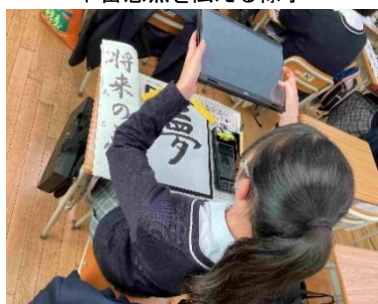
↑タブレット端末で撮影