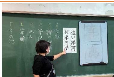
↑留意点を伝える様子