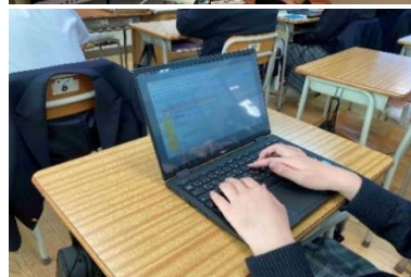
↑タブレットシートに振り返りを記入