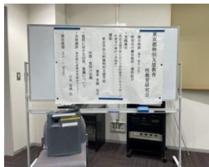
令和5年5月20日（土） 第1回研究協議会の様子 国立オリンピック記念青少年総合センター 国際交流棟で実施