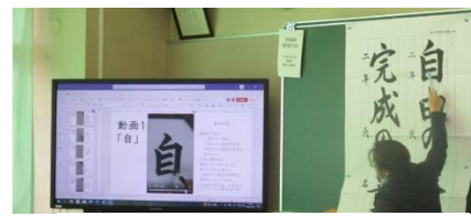
↑留意点を伝える様子