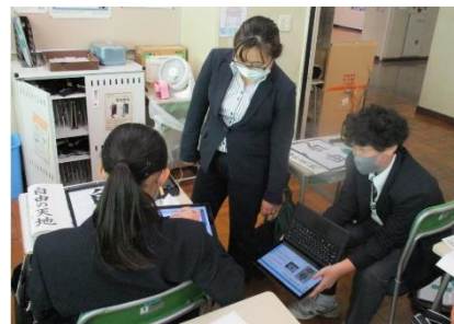
↑ツインミーティングの様子