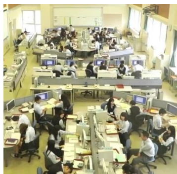
第三商業の総合実践