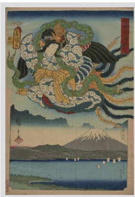
「雙筆五十三次 江尻」

We have ukiyoe woodblock prints, sugoroku board games and various ranking lists.