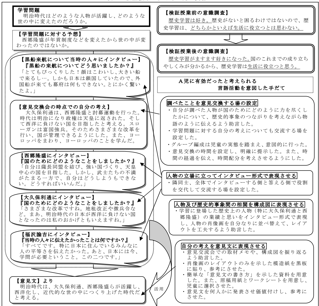
表1 検証授業におけるA児の変容

検証授業後の意識調査で大きな変容が見られたA児を観察対象児として選び、有効だったと考えられる言語活動を意図した手だてと照らし合わせて分析した。